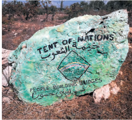
Das „Tent of Nations“ / Zelt der Völker: ein Hügel als Ort der Begegnung und Versöhnung – und ein pädagogischer und ökologischer Familienbetrieb südwestlich von Bethlehem.

Ein aktuelles Beispiel für die Friedensbemühungen religiöser Akteure ist die multireligiöse Konsultation „Das Gebot des Friedens im Mittleren Osten und im Iran“ von 40 Vertreter:innen aller Weltreligionen, die am 9. April 2026 in einer Stellungnahme wichtige Schritte für den Weg zu einem ge-