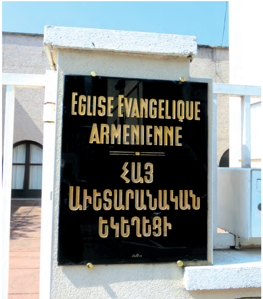
Lyon 3e – Evangelikale Kirche in Armenien, Metallplatte (April 2019)

Eurasien (gegr. 1995): Gemeinden in Georgien, Russland und Abchasien, entstanden nach dem Zusammenbruch der Sowjetunion.