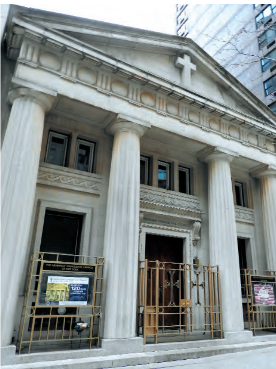
Armenian Evangelical New York