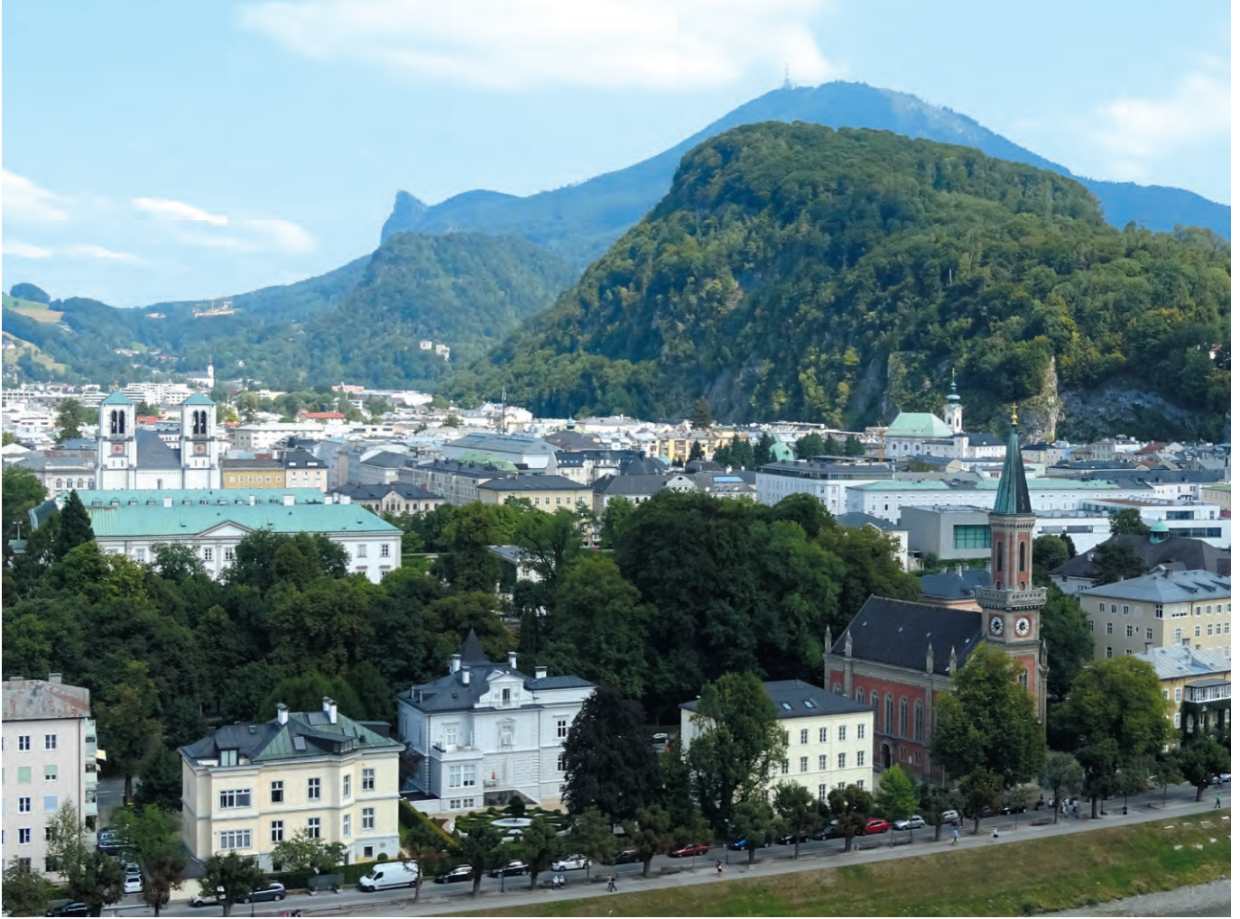
Blick vom Mönchsberg auf die Salzburger Neustadt – die hellrote Kirche im Bildvordergrund ist die evangelische Christuskirche A.u.H.B.

werterweise formuliert die Erklärung in den Thesen 2 und 3 kirchliche Grundrechte aller getauften Mitglieder. Sie hat damit schon vor 30 Jahren einen wichtigen Beitrag zur Debatte über kirchliche Grundrechte geleistet, die auch in anderen Kirchen geführt worden ist. Wie es Grundrechte im Staat gibt, so auch spezifische Grundrechte in der Kirche, die aus der Taufe und dem in ihr gründenden Priestertum alle Gläubigen hervorgehen.