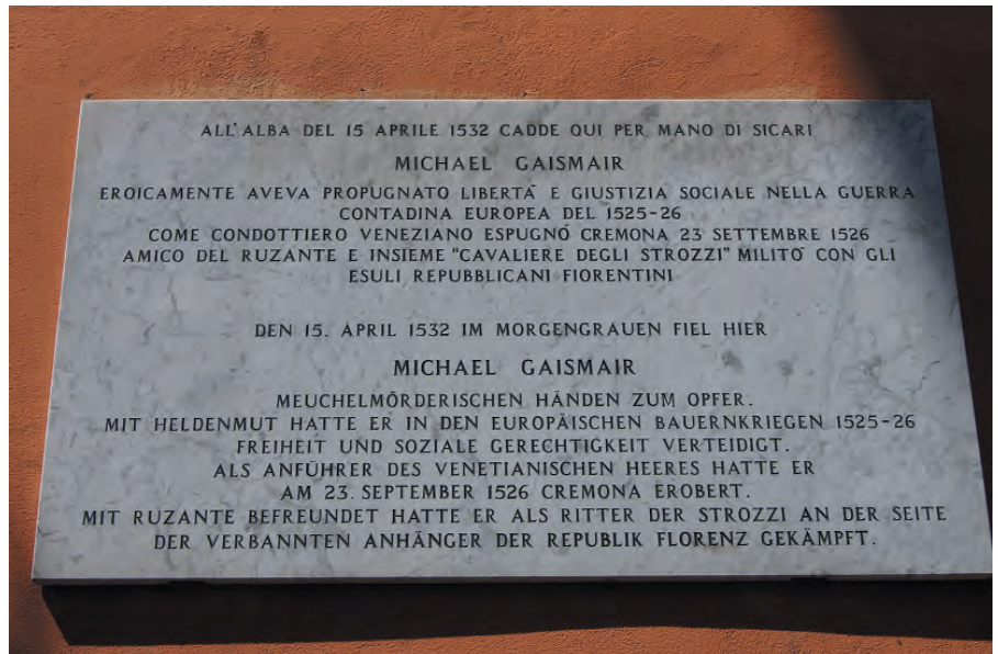
Gedenktafel zur Erinnerung an die Ermordung von Michael Gaismair in Padua, im Prato della Valle.

Vor 500 Jahren tobte einer der folgenschwersten Kriege Mitteleuropas, der mit einer blutigen Niederlage der aufbegehrenden Bauern endete, uns aber mit Gaismairs Verfassungsentwurf ein ideengeschichtlich bedeutsames Manifest hinterließ. Von Martin Luthers Schrift „Von der Freiheit eines Christenmenschen“ (1520) beflügelt, wurden von der Bauernbewegung Freiheitssignale und Gleichheitsforderungen gegen die mittelalterliche Feudalherrschaft gesetzt und Luthers theologische Fragen ins Profane und Alltägliche übersetzt. Mit erbeuteten Waffen, mit Dreschflegeln, Sensen und Morgensternen gingen die aufständischen Bauern 1525 gegen die Obrigkeit und die Heerscharen des Schwäbischen Fürstenbundes vor, und Burgen und Klöster wurden zerstört. Nach dem Spießrutenlaufen von 27 Adligen bei der Weinsberger Bluttat wandte sich Luther allerdings äußerst heftig gegen die Bauernhufen. Die fürstlichen Reiterheere be-