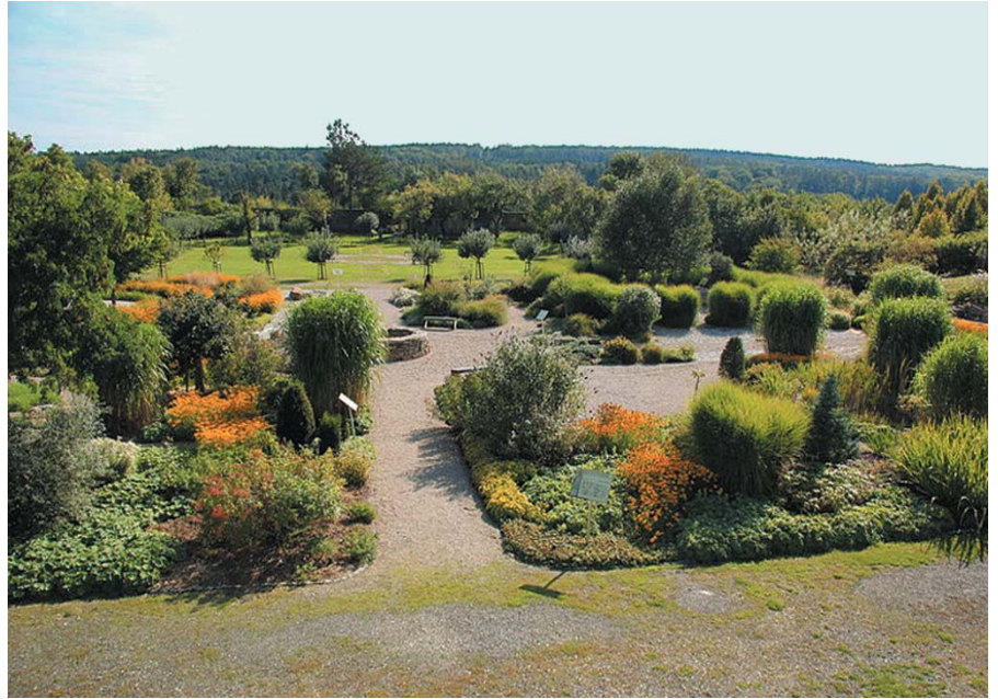
Garten der Religionen Stift Altenburg