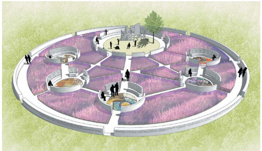
Geplanter Garten der Religionen in Karlsruhe

Allen übrigen Religionen ist ein neu ausgepflanzter Baumkreis gewidmet.